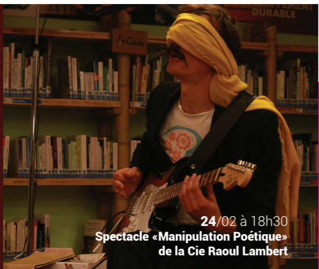
24/02 à 18h30 Spectacle «Manipulation Poétique» de la Cie Raoul Lambert