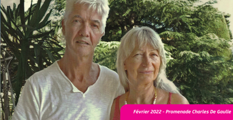
Février 2022 - Promenade Charles De Gaulle