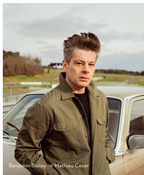
Benjamin Biolay