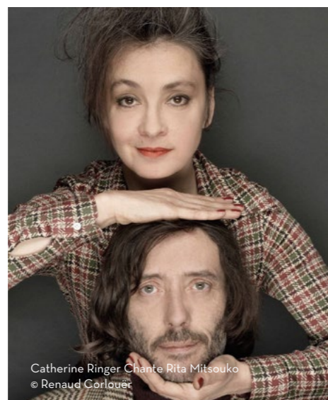
Catherine Ringer Chante Rita Mitsouko