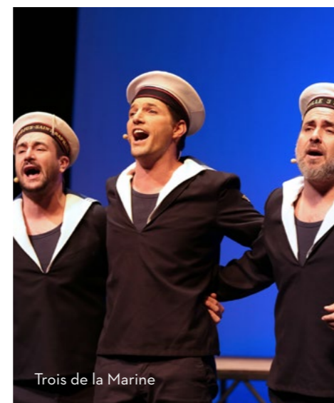
Trois de la Marine