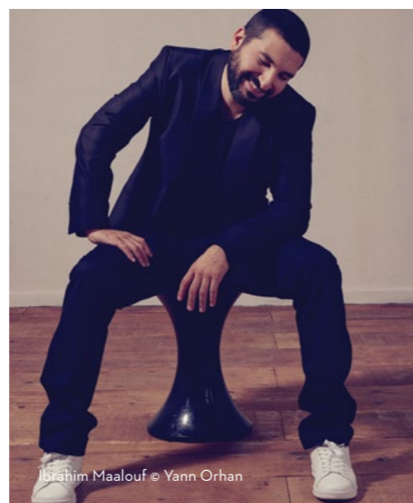
Ibrahim Maalouf