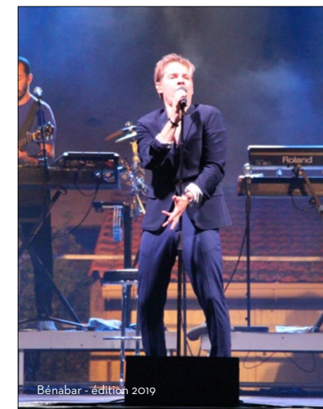
Bénabar - édition 2019