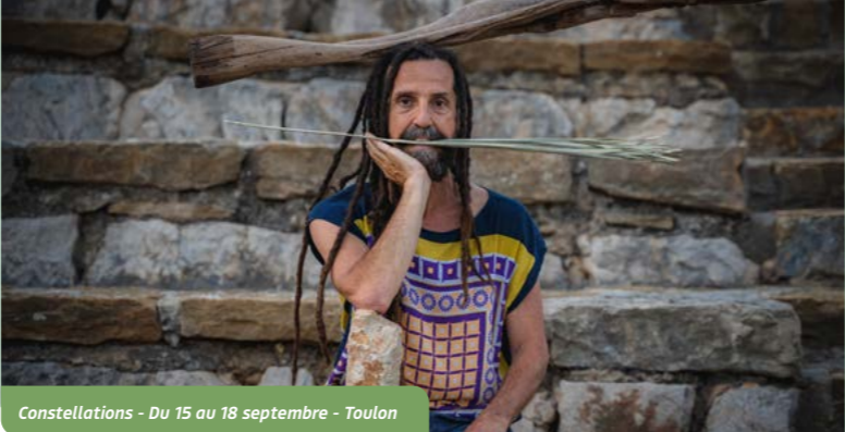
Constellations - Du 15 au 18 septembre - Toulon

D'évidence un festival de danse s'intéresse au mouvement mais au-delà de la qualité des gestes, il regarde vers d'autres déplacements avec l'envie de bouger les lignes. Ces arts chorégraphiques sont mouvants, c'est un mix de cultures en contact dynamique avec d'autres domaines. Les enjeux esthétiques ne sont pas en dehors de nos vies quotidiennes, ils permettent de les traverser sensiblement. C'est une édition qui déploie des passerelles entre cultures scientifiques et artistiques : une conférence flottante avec un géographe où il faudra se mettre à l'eau, des conversations bord de mer sur nos identités côtières (on parlera météo avec un prévisionniste, haute mer et préservation des océans, canicule et méga-feux...). Ce festival prend corps à Toulon : il dépeint les spécificités