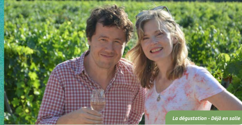
La dégustation - Déjà en salle