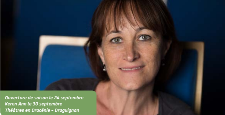
Ouverture de saison le 24 septembre Keren Ann le 30 septembre Théâtres en Dracénie - Draguignan