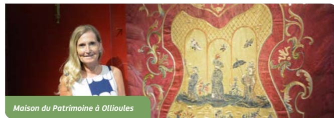
Maison du Patrimoine à Ollioules