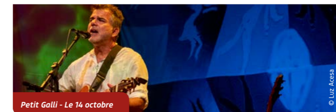
Petit Galli - Le 14 octobre