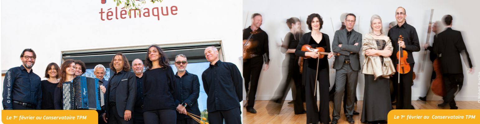
Le 1 er février au Conservatoire TPM