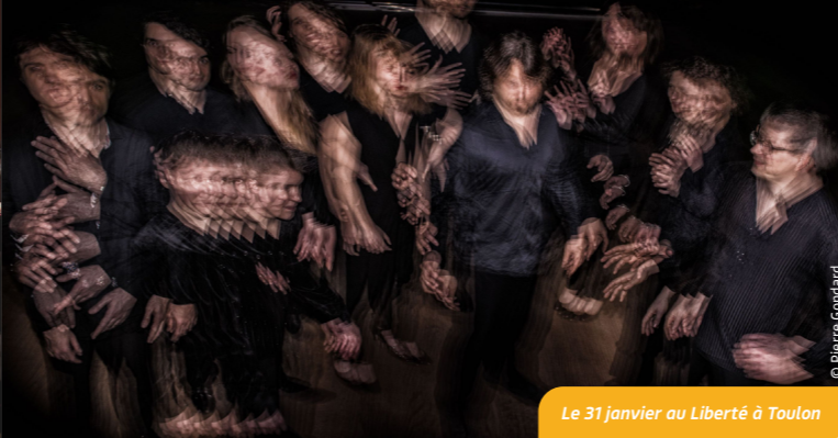
Le 31 janvier au Liberté à Toulon