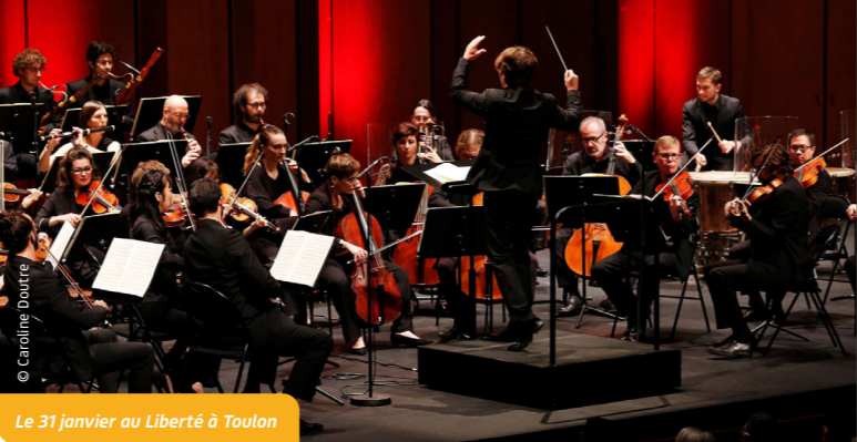
Le 31 janvier au Liberté à Toulon

Notre cycle Brahms continue à se développer la saison prochaine notamment au Grand Théâtre de Provence et à Grenoble avec le "Double concerto" pour violon et violoncelle. Nous donnons aussi un programme lyrique sur le thème de l'amour avec la soprano Julie Fuchs à Aix et Lyon. Après nos débuts en janvier dernier, nous retrouverons la Philharmonie de Paris dans la magnifique "Missa solemnis" de Beethoven. Après "La Traviata", "Rigoletto", nous retrouverons la "trilogie populaire" de Verdi avec "Le Trouvère" cet été.