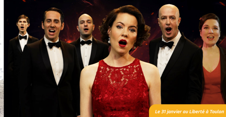
Le 31 janvier au Liberté à Toulon