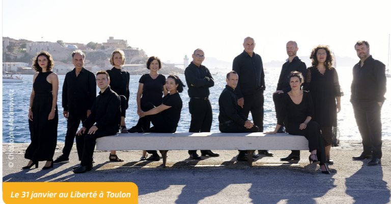
Le 31 janvier au Liberté à Toulon