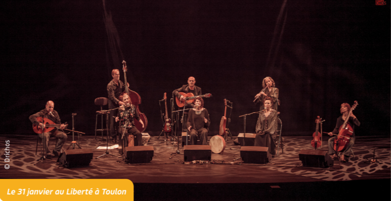
Le 31 janvier au Liberté à Toulon

"Un grand silence de tambour" : avec l'Abbaye de Noirlac et le GEMM, spectacle participatif associant la compagnie, une école primaire et des jeunes demandeurs d'asile, autour de compositions électroacoustiques, d'ateliers de création sonore, de chants de la guerre d'Espagne et de collectages (création mai 2023 - Les Futurs de l'Écrit). À suivre : une création jeune public en 2024, sur le thème des récits d'enfance en temps d'exil.