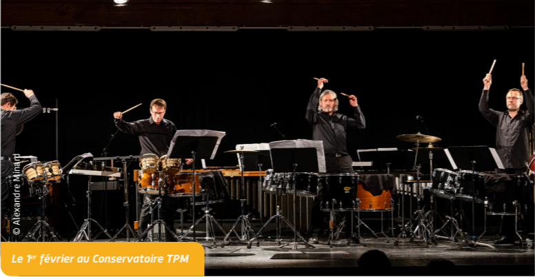
Le 1 er février au Conservatoire TPM