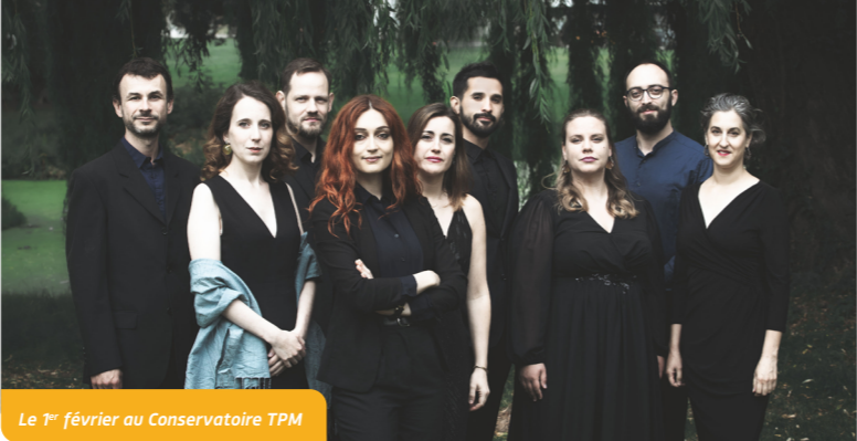
Le 1 er février au Conservatoire TPM

Une belle saison 2023 s'annonce, nous avons la chance de pouvoir nous développer à l'international. L'un de nos "highlights" sera le festival Misteria Paschalia de Cracovie en Avril prochain. Nous avons également une création à l'automne 2023 qui verra les débuts de l'Ensemble Irini avec des instruments. En effet deux trompettes médiévales/sacqueboutes viendront s'ajouter à l'octuor vocal mixte. Ce programme s'appelle "Dufay au Péloponnèse" et raconte l'histoire de l'union ratée des deux Églises d'Orient et d'Occident qui s'est soldée par la chute de Constantinople. C'est un fait peu connu mais Guillaume Dufay a été aux premières loges de cet épisode crucial de l'Histoire. Les motets de Dufay seront mis en dialogue avec des pièces byzantines composées à la même époque, parfois pour les mêmes événements. Cavalier Blanc