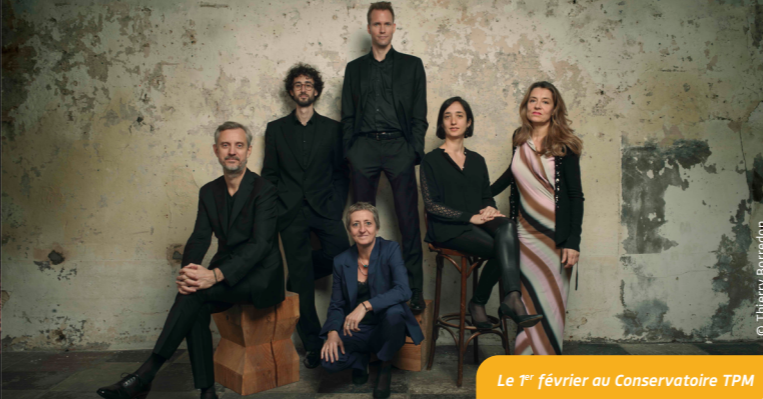
Le 1 er février au Conservatoire TPM