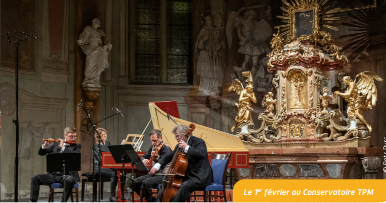
Le 1 er février au Conservatoire TPM