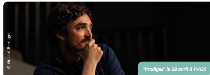
"Prodiges" le 28 avril à 14h30

Ma relation avec Mozaïc a beaucoup évolué durant les dernières années ! Jusqu'en 2019, je faisais appel à Mozaïc pour la comptabilité et les fiches de paie, mais j'étais très autonome sur le reste et j'avais beaucoup de mal à déléguer... Depuis environ cinq ans, j'ai lâché prise, au fur et à mesure que les services ont évolué chez Mozaïc. Aujourd'hui, c'est un pur régal et je ne reviendrais pas en arrière ! Pour moi, la grande force de Mozaïc, c'est la somme de connaissances. En face