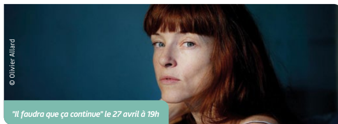
"Il faudra que ça continue" le 27 avril à 19h