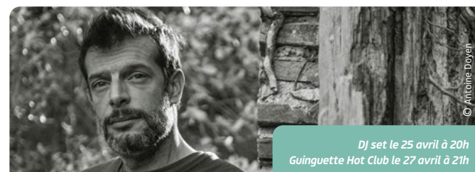
DJ set le 25 avril à 20h Guinguette Hot Club le 27 avril à 21h