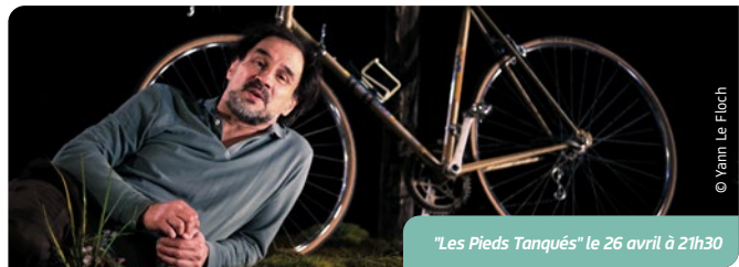
"Les Pieds Tanqués" le 26 avril à 21h30