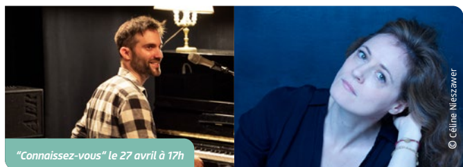
"Connaissez-vous" le 27 avril à 17h

Ce qui nous relie, nous rassemble, dans un monde où la solitude semble omniprésente, malgré notre entourage, devient une question de plus en plus présente. Dans une ère marquée par une individualité croissante, il est fréquent de ressentir un sentiment d'isolement, même au sein d'une foule. C'est une préoccupation grandissante que j'observe de plus en plus autour de moi. Comment établir des liens avec autrui ? Qu'est-ce qui déclenche ce moment où nous avons envie de danser ensemble et de vivre en harmonie ?