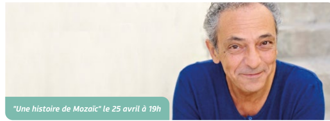
"Une histoire de Mozaïc" le 25 avril à 19h

Au début des années 2000, nous avons créé le Collectif des Compagnies où environ vingt-cinq compagnies du Var ont appris à mieux se connaître et à inventer de la solidarité entre elles. Plus tard, nous avons créé deux groupements d'employeurs et c'est là que nous avons