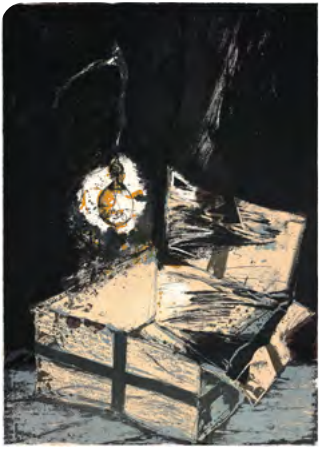
Paul Rebeyrolle, A la lumière des sondages, 1979 Lithographie originale sur vélin d'Arches Collection Fondation Marguerite et Aimé Maeght, Saint-Paul-de-Vence

Artistes présentés : Antoni Tàpies (1923-2012), Paul Rebeyrolle (1926-2002), Jean Paul Riopelle (1923-2002), Valerio Adami (1935), Jacques Monory (1924-2018)