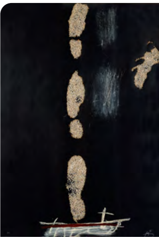
Antoni Tàpies, Empreintes de pas, 1972 Lithographie originale et collage sur Chiffon de Mandeure Collection Fondation Marguerite et Aimé Maeght, Saint-Paul-de-Vence

Tàpies est fasciné par la permanence des choses, il maltraite, déploie les objets qu'il utilise dans ses œuvres. Ces mêmes tentatives sont mises en œuvre dans son travail gravé. Représenté par Maeght à partir des années 60, il réussit à transposer sa pratique du détournement qu'il réemploie dans la lithographie : il développe des techniques inédites comme l'usage du crin (en collage) ou du riz (en empreinte pour marquer le papier). La technique mixte au cœur de son travail prend tout son sens dans la trace qu'elle laisse sur le papier : l'empreinte devient signifiante. La technicité n'est jamais loin de l'œuvre de Tàpies, il parvient à innover, tout en restant fidèle à son travail matiériste. Les motifs demeurent récurrents : la croix, les traits géométriques, les mains... comme autant de signes qui l'identifient.