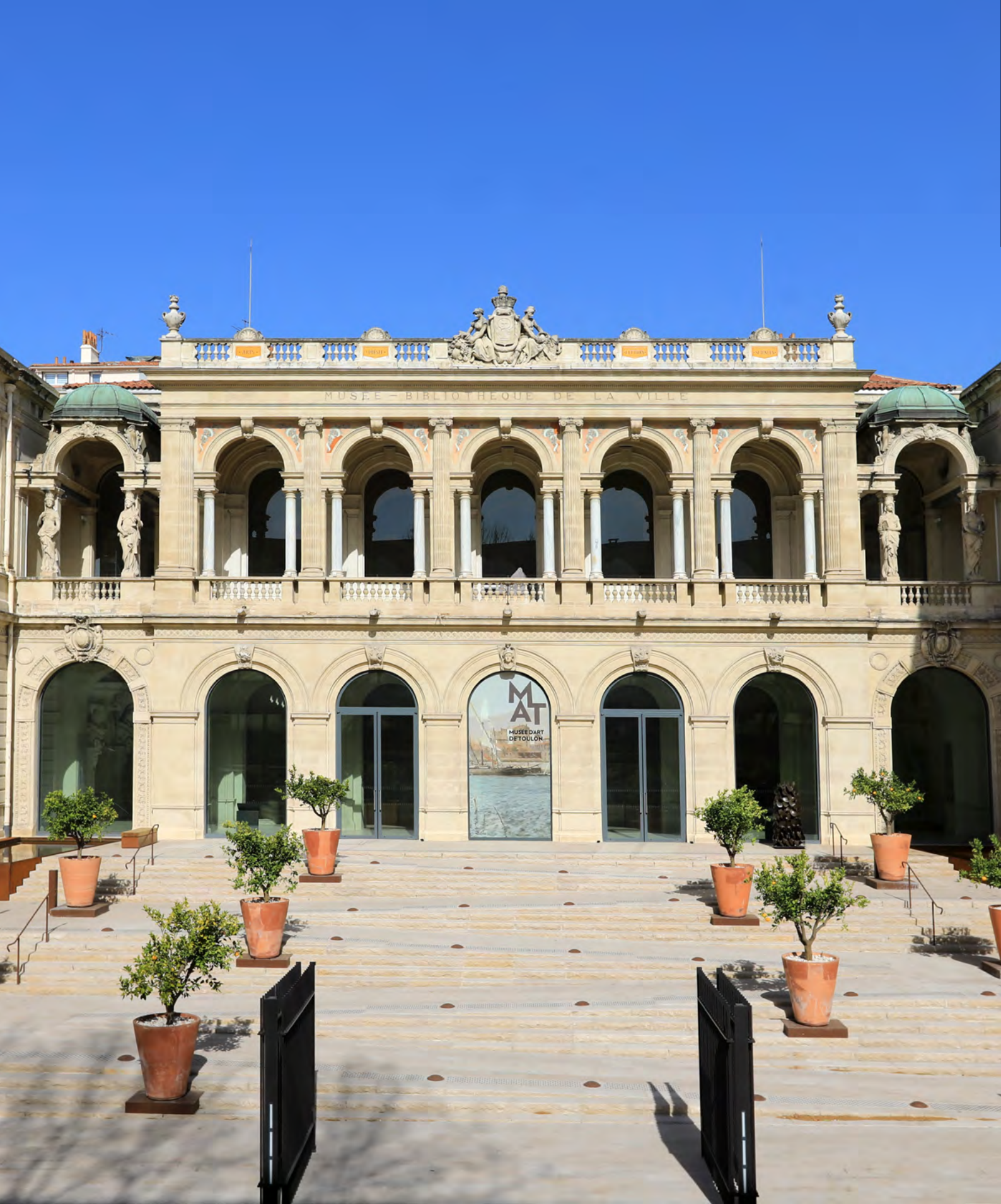
Braque, Calder, Chagall, Giacometti, Miró... Les ateliers de la modernité Une exposition du Musée d'Art de Toulon en partenariat avec la Fondation Marguerite et Aimé Maeght