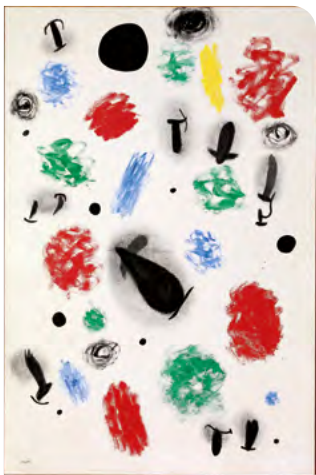
Joan Miró, Le Chant de la prairie , 1964, Huile sur toile Collection Fondation Marguerite et Aimé Maeght, Saint-Paul-de-Vence

Cette œuvre illustre l'apogée de l'artiste lors de sa période majoritaire. Après quatre années consacrées à l'exploration de l'édition et de la céramique, il retrouve, en 1959, la peinture avec une pratique artistique renouvelée. La toile intègre ses acquis précédents : formes simplifiées biomorphiques, couleurs vives et liberté gestuelle. La prairie est suggérée ici de manière abstraite. Signes noirs épais et touches de couleurs vives rythment la composition. Ces motifs évoquent des éléments naturels donnant à l'œuvre une dimension poétique, véritable ode à la nature.