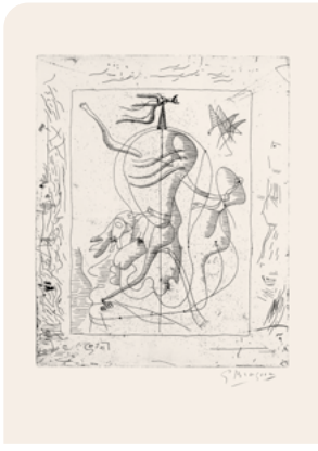
Georges Braque, La Théogonie d'Hésiode - planche o - Gaïa , 1930 Eau-forte originale sur Hollande van Gelder Collection Fondation Marguerite et Aimé Maeght, Saint-Paul-de-Vence ©Adagp, Paris, 2026 / Galerie Maeght, Paris