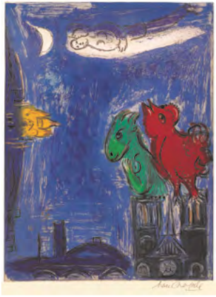
Marc Chagall, Les Monstres de Notre-Dame, 1954 Lithographie originale sur vélin d'Arches Collection Fondation Marguerite et Aimé Maeght, Saint-Paul-de-Vence