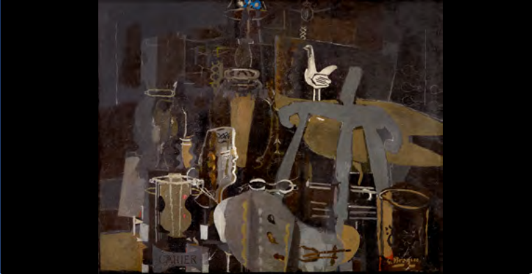
Georges Braque, Atelier VI, 1950-1951 Huile sur toile Collection Fondation Marguerite et Aimé Maeght, Saint-Paul-de-Vence

Le Musée d'Art s'associe aujourd'hui à la Fondation Marguerite et Aimé Maeght pour présenter "Les ateliers de la modernité", une exposition consacrée à de grandes figures de l'art moderne. À travers un ensemble remarquable de gravures signées notamment de Braque, Calder, Chagall, Giacometti ou Miró, cette exposition reflète en arrière-plan le rôle essentiel de la Fondation Maeght dans l'accompagnement des artistes : lieux de création, soutien éditorial avec la revue d'art "Derrière le miroir" ou encore diffusion des œuvres par la Galerie parisienne. Dès le 31 janvier, plus de soixante-dix œuvres, tout autant précieuses que fragiles, invitent le visiteur à