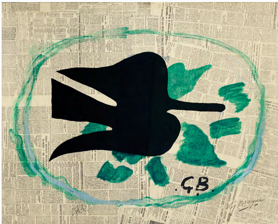
Georges Braque, Oiseau dans le feuillage , 1962, lithographie originale sur BFK Rives, 80 x 105 cm, Maeght Éditeur, Paris © ADAGP, Paris, 2026 - Photo Claude Germain - Archives Fondation Maeght

En partenariat avec la Fondation Marguerite et Aimé Maeght Musée d'Art de Toulon