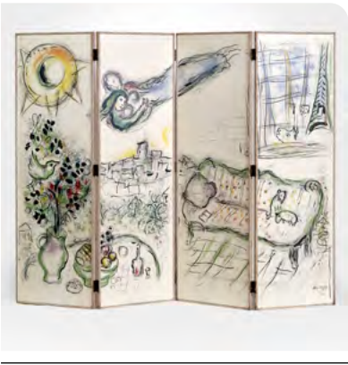
Marc Chagall, Paravent , 1963 Lithographies originales sur vélin d'Arches collées sur bois Collection Fondation Marguerite et Aimé Maeght, Saint-Paul-de-Vence ©Adagp, Paris, 2026

En 1958, Marc Chagall découvre, lors d'un séjour en Suisse chez l'éditeur Gérard Cramer un paravent de Pierre Bonnard. Avec des artisans spécialisés, l'artiste étend la lithographie au domaine de l'objet, transformant ainsi cette œuvre gravée en véritable élément décoratif. Achevés en 1963, les quatre panneaux mobiles illustrent les thèmes de prédilection de l'artiste : animaux, amoureux flottants, bouquet de fleurs, évocation de Paris et Vence (où il vit depuis 1950).