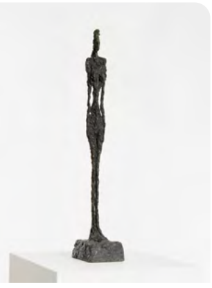
Alberto Giacometti, Femme haut chignon, 1948 Bronze Collection Fondation Marguerite et Aimé Maeght, Saint-Paul-de-Vence

Autre artiste présenté dans la section : Eduardo Chillida (1924-2002)