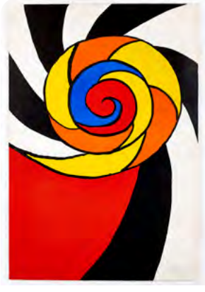
Alexander Calder, Turban, 1969 Lithographie originale sur Chiffon de Mandeure Collection Fondation Marguerite et Aimé Maeght, Saint-Paul-de-Vence

Autres artistes présentés dans la section : Pablo Palazuelo (1916-2007), Pol Bury (1922-2005)