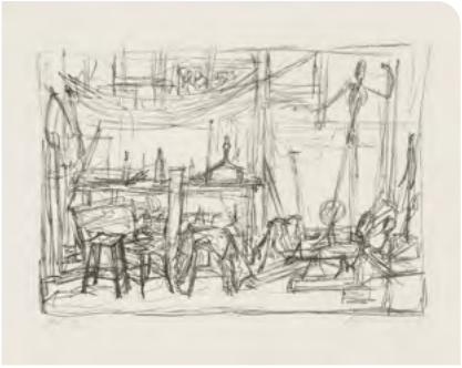
Alberto Giacometti, L'Atelier II, 1954 Lithographie originale sur vélin d'Arches Collection Fondation Marguerite et Aimé Maeght, Saint-Paul-de-Vence

Dans son œuvre gravée, Giacometti utilise des sujets familiers : figures isolées, bustes et têtes, vues de l'atelier encombré. Graver relève pour lui d'un travail de sculpteur : il n'est donc pas anodin qu'il représente si fréquemment son propre atelier. Il aborde la gravure sans se soucier des contraintes techniques du médium : graver revient à dessiner à la plume. Ce procédé lui permet un travail du trait moins précis, plus direct, sans rature possible, avec une spontanéité qui n'entrave pas la lisibilité de la composition. Les lignes de fuite, clairement établies, témoignent de la maîtrise spatiale du sculpteur habitué à penser son travail en volume.