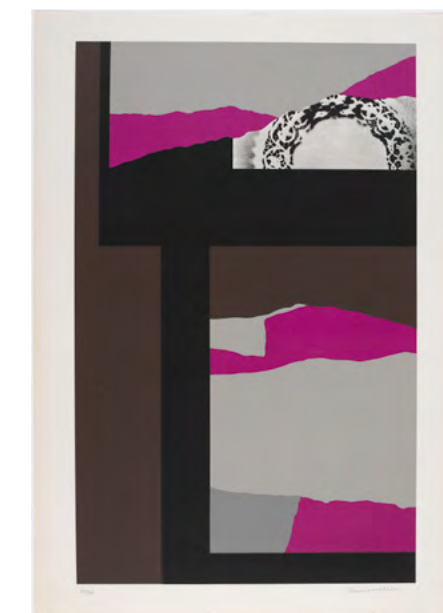
Nevelson Louise (dit), Berliawsky Louise (1900-1988), Sans titre Sérigraphie sur papier Arches, Musée d'Art de Toulon

L'œuvre présentée dans cette exposition a été conçue par le procédé de la sérigraphie. Si la technique change, on retrouve la même utilisation de l'assemblage et une construction géométrique rigoureuse. Les touches de couleur vives travaillées en aplat, caractéristiques de la période tardive de sa carrière, ponctuent et rythment le tirage.