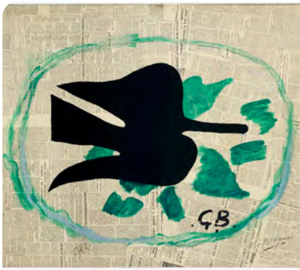
Georges Braque, L'Oiseau dans le feuillage , 1961 Lithographie originale sur BFK Rives contrecollé sur carton, Collection Fondation Marguerite et Aimé Maeght, Saint-Paul-de-Vence