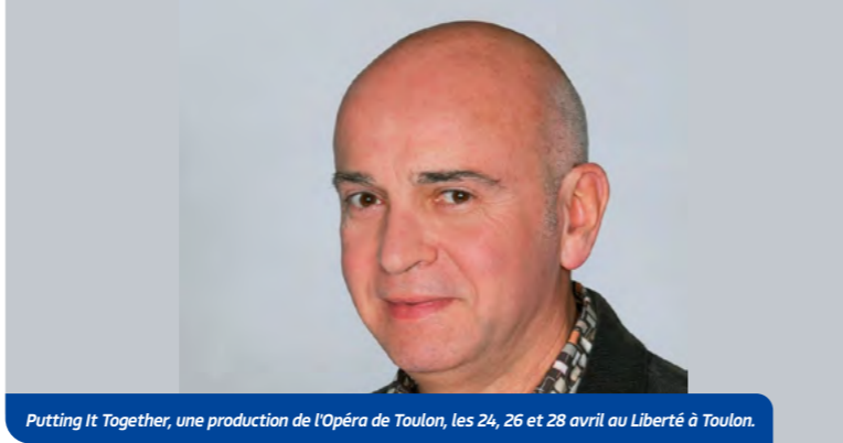
Putting It Together, une production de l'Opéra de Toulon, les 24, 26 et 28 avril au Liberté à Toulon.

monde, sans exclure personne. Si on n'a pas ce plaisir de partager, il faut laisser la place aux autres ! En bref, "Putting It Together" est une plongée dans les coulisses du théâtre musical, où exigence, humour et humanité se mêlent pour offrir au public un moment unique.