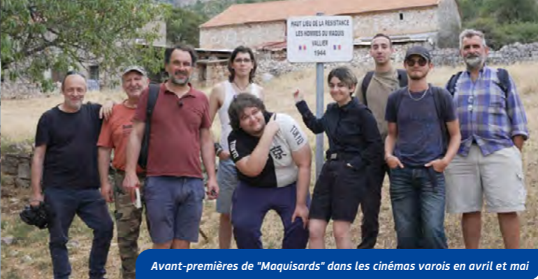
Avant-premières de "Maquisards" dans les cinémas varois en avril et mai