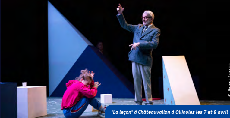
"La leçon" à Châteauvallon à Ollioules les 7 et 8 avril

A Châteauvallon, Robin Renucci présentera sa mise en scène de "La Leçon" d'Eugène Ionesco. Entre rire et malaise, dans ce classique incontournable du théâtre de l'absurde, l'acteur et metteur en scène explore les mécanismes de domination, de langage et de pouvoir.