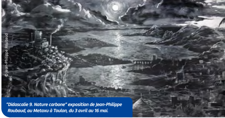
"Didascalie 9. Nature carbone" exposition de Jean-Philippe Roubaud, au Metaxu à Toulon, du 3 avril au 16 mai.

L'artiste plasticien Jean-Philippe Roubaud investit l'espace d'artistes Metaxu avec des wall drawings, de grands dessins, ou encore une petite série de dessins au graphite sur bois, aux sujets toujours en tension entre le réalisme et l'abstraction, le naturel et l'artificiel. À découvrir absolument.