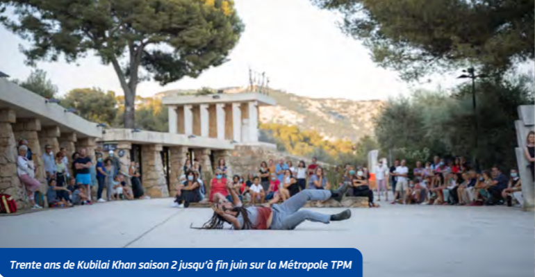
Trente ans de Kubilai Khan saison 2 jusqu'à fin juin sur la Métropole TPM