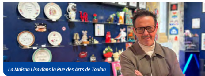
La Maison Lisa dans la Rue des Arts de Toulon

Il serait difficile de tous les citer mais sur le fond, la démarche artistique demeure identique mais s'ouvre à la création internationale. Les artistes historiques liés à l'illustration et au digital sont désormais accompagnés de créations issues d'univers complémentaires : créateurs, objets insolites, déco décalée, collaborations exclusives et des idées cadeaux à partir de neuf euros : idéal pour faire ou se faire un petit cadeau ! On élargit du strict champ de l'illustration vers des univers plus transversaux : un corner "dépôt-vente" de créations décalées, un mur dédié à la décoration de la maison, du petit mobilier, des collections hybrides entre art et design et toujours un clin d'œil au street art.... L'idée est de créer une cohérence esthétique globale. Chaque pièce doit raconter une expérience, provoquer une réaction ou créer un attachement immédiat. Enfin, ce repositionnement permet une rotation plus rapide des collections, avec une logique de nouveauté constante. Là où une galerie classique fonctionne par expositions, Maison LISA fonctionne par sélections évolutives compte tenu des tendances actuelles. Chaque objet pré-