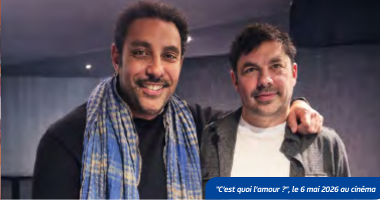
"C'est quoi l'amour ?", le 6 mai 2026 au cinéma