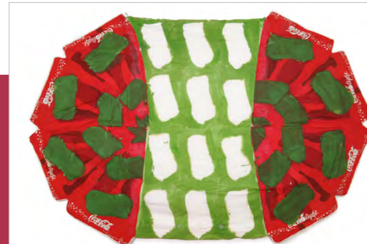
Claude Viallat, sans titre, 2011, peinture acrylique sur montage de parasol et drap, 270 cm x 180 cm, « Atelier de l'artiste » [num.inv. 001/2011]. © ADAGP, Paris, 2025