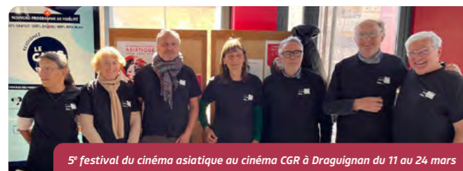
5 e festival du cinéma asiatique au cinéma CGR à Draguignan du 11 au 24 mars

Votre association Entretoiles mène de nombreuses actions autour du cinéma en Dracénie. Pouvez-vous nous présenter vos activités ?