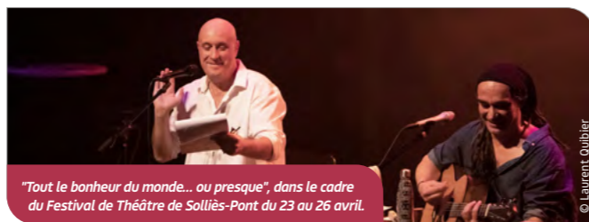
"Tout le bonheur du monde... ou presque", dans le cadre du Festival de Théâtre de Solliès-Pont du 23 au 26 avril.