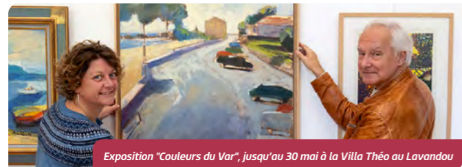
Exposition "Couleurs du Var", jusqu'au 30 mai à la Villa Théo au Lavandou