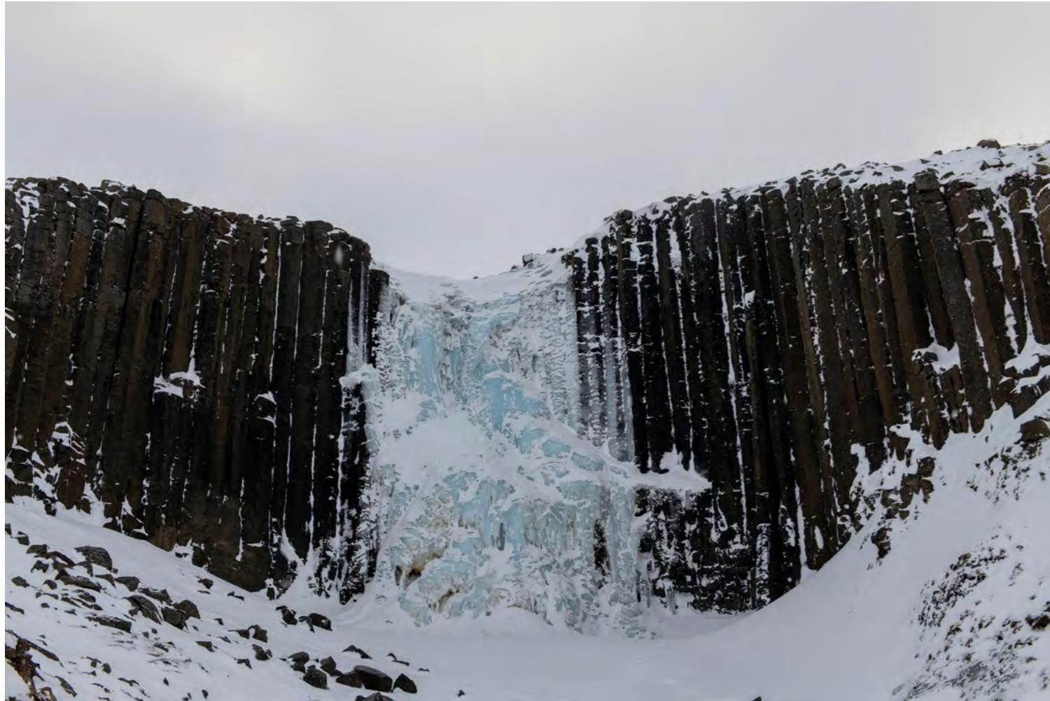
Studiafossa, canyon Studlagil