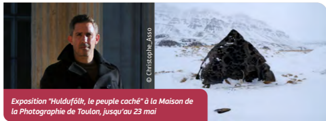
Exposition "Huldufólk, le peuple caché" à la Maison de la Photographie de Toulon, jusqu'au 23 mai

Né à la Ciotat, Michel Eisenlohr est un photographe voyageur, qui pose un regard profond sur la relation entre les humains et leur environnement. Il capte avec poésie l'âme des paysages. Une exposition à la Maison de la Photo à ne pas manquer.