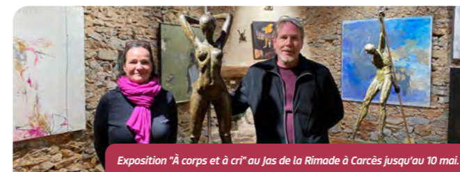
Exposition "À corps et à cri" au Jas de la Rimade à Carcès jusqu'au 10 mai.