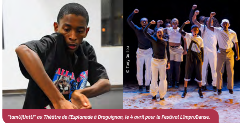
"tamUjUntU" au Théâtre de l'Esplanade à Draguignan, le 4 avril pour le Festival L'impruDanse.

Invité du Festival L'impruDanse, organisé par les Théâtres en Dracénie, le célèbre chorégraphe brésilien Paulo Azevedo s'associe avec la non-moins célèbre cie sud-africaine Via Katlehong et présente "tamUjUntU", une création qui met en dialogue les danses urbaines du Brésil et d'Afrique du Sud. À travers ce spectacle, il explore la manière dont les cultures se rencontrent, se transforment et produisent de nouvelles formes de mouvement.