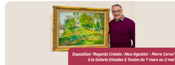
Exposition "Regards Croisés : Max Agostini - Pierre Cornu" à la Galerie Estades à Toulon du 7 mars au 2 mai

La Galerie Estades à Toulon présente une exposition consacrée à Max Agostini et Pierre Cornu, à travers une quarantaine d'œuvres issues de l'ancienne collection de Janet Greenberg. Michel Estades rend hommage à deux artistes majeurs du XX e siècle qui ont célébré la femme, la couleur et la lumière avec des sensibilités différentes mais complémentaires.