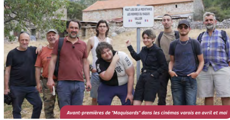
Avant-premières de "Maquisards" dans les cinémas varois en avril et mai