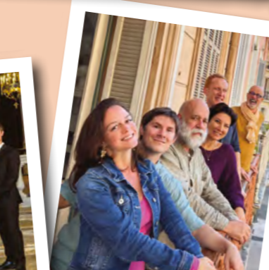
OCTOBRE : la beauté de la poésie de Ronsard et Marot avec « La Fleur des musiciens ».