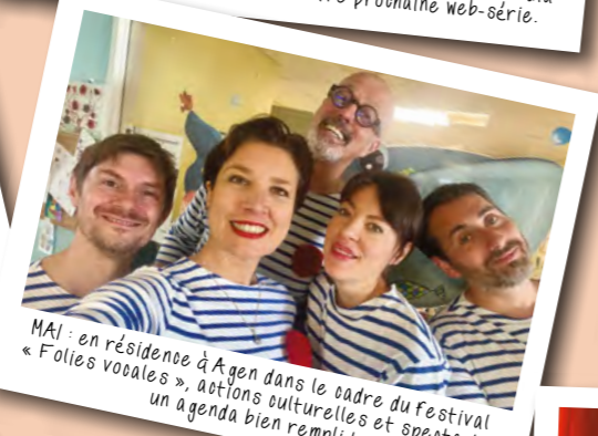
MAI : en résidence à Agen dans le cadre du festival « Folies vocales », actions culturelles et spectacle, un agenda bien rempli !