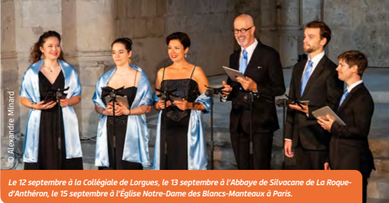
Le 12 septembre à la Collégiale de Lorgues, le 13 septembre à l'Abbaye de Silvacane de La Roque-d'Anthéron, le 15 septembre à l'Église Notre-Dame des Blancs-Manteaux à Paris.