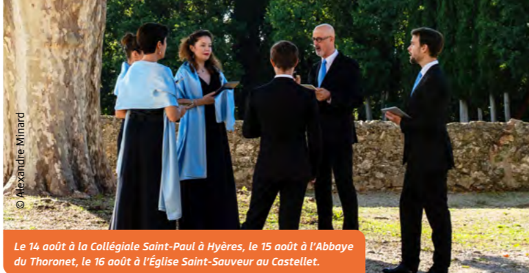
Le 14 août à la Collégiale Saint-Paul à Hyères, le 15 août à l'Abbaye du Thoronet, le 16 août à l'Église Saint-Sauveur au Castellet.