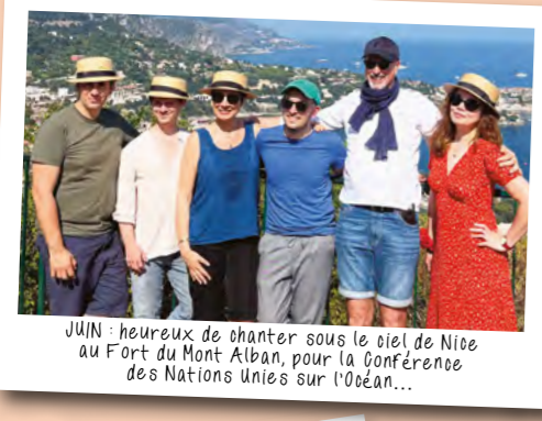
JUIN : heureux de chanter sous le ciel de Nice au Fort du Mont Alban, pour la Conférence des Nations Unies sur l'Océan...