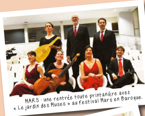
MARS : une rentrée toute printanière avec « Le Jardin des Musées » au festival Mars en Baroque.