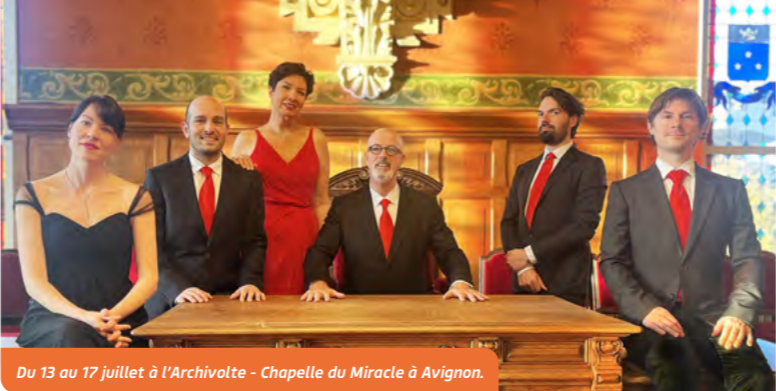
Du 13 au 17 juillet à l'Archivolte - Chapelle du Miracle à Avignon.