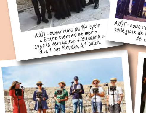
SEPTEMBRE : répétition de notre fameux « Concert des 500 » à la Tour Royale, annulé in extremis en raison d'une alerte orange !