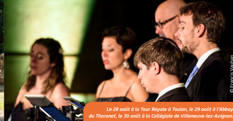
Le 28 août à la Tour Royale à Toulon, le 29 août à l'Abbaye du Thoronet, le 30 août à la Collégiale de Villeneuve-lez-Avignon.