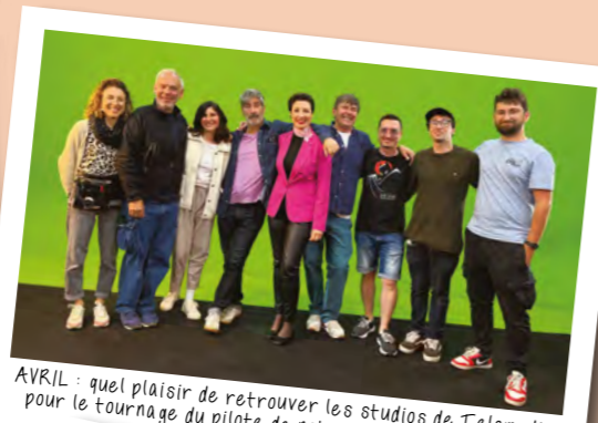
AVRIL : quel plaisir de retrouver les studios de Telomedia pour le tournage du pilote de notre prochaine web-série.