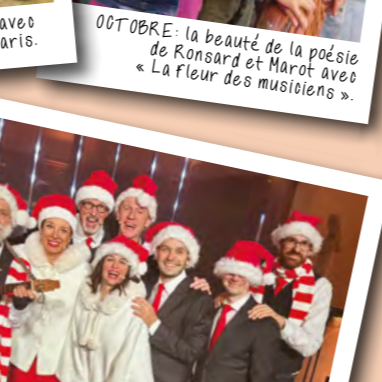
DÉCEMBRE : Clap de fin sur notre intense et magnifique « Tournée des Chants de Noël » du Département des Bouches-du-Rhône.