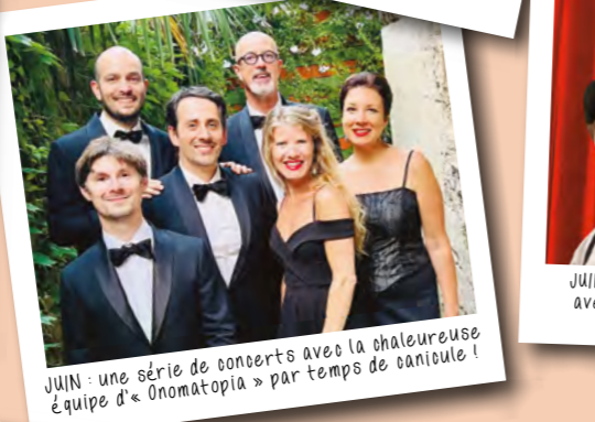
JUIN : une série de concerts avec la chaleureuse équipe d'« Onomatopia » par temps de canicule !