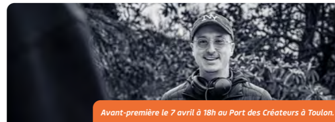
Avant-première le 7 avril à 18h au Port des Créateurs à Toulon.