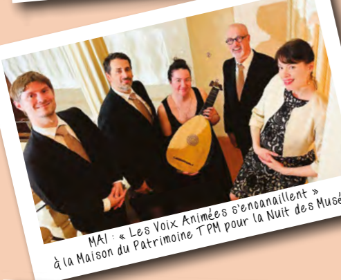
MAI : « Les Voix Animées s'engoulaillent » à la Maison du Patrimoine TPM pour la Nuit des Musées.