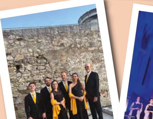
AOÛT : ouverture du 14 e cycle « Entre pierres et mer » avec la vertueuse « Susanna » à la Tour Royale, à Toulon.