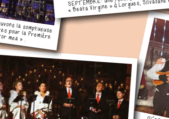
DÉCEMBRE : une mémorable série de concerts illuminés de mille bougies par le festival « Sacrée Musique ».