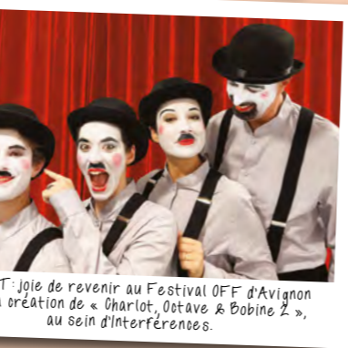
JUILLET : joie de revenir au Festival OFF d'Avignon avec la création de « Charlot, Octave & Bobine 2 », au sein d'Interférences.