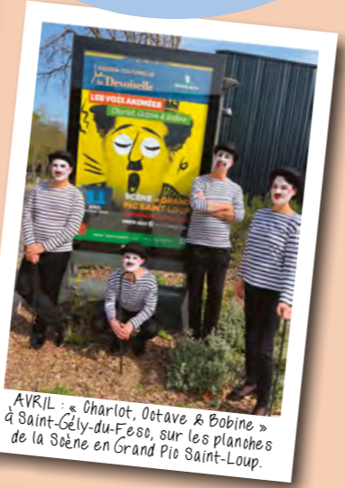
AVRIL : « Charlot, Octave & Bobine » à Saint-Cély-du-Fesno, sur les planches de la Scène en Grand Pio Saint-Loup.