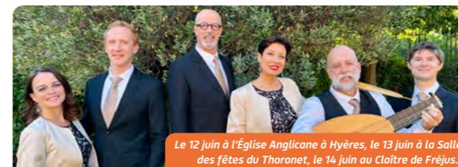
Le 12 juin à l'Église Anglicane à Hyères, le 13 juin à la Salle des fêtes du Thoronet, le 14 juin au Cloître de Fréjus.