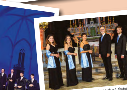
AOÛT : nous retrouvons la somptueuse collégiale de Hyères pour la Première de « Soror mea ».