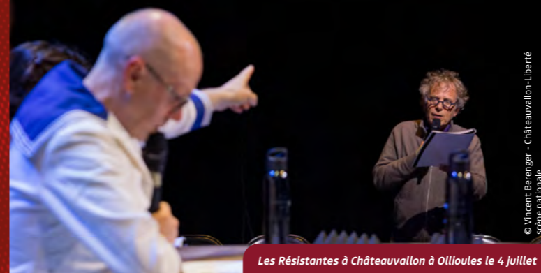
Les Résistantes à Châteauvallon à Ollioules le 4 juillet