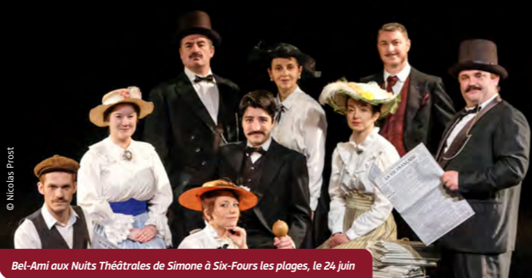
Bel-Ami aux Nuits Théâtrales de Simone à Six-Fours les plages, le 24 juin