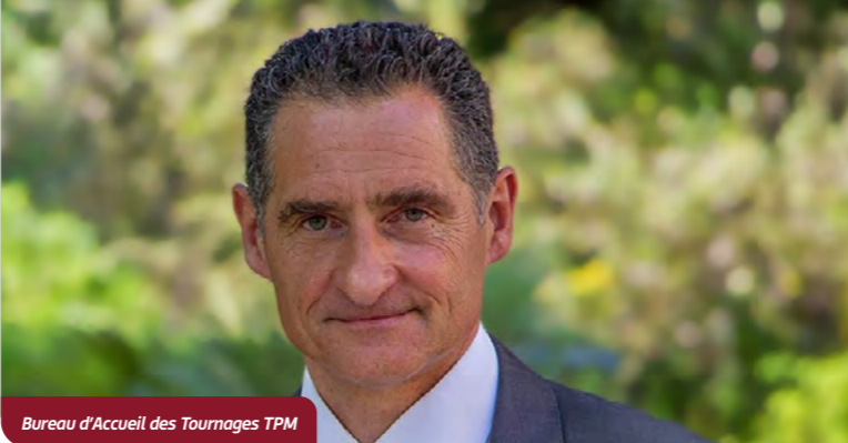
Bureau d'Accueil des Tournages TPM

Cette rencontre professionnelle a pour objectif de réunir de nombreux professionnels de la filière impliqués sur le territoire.