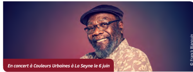
En concert à Couleurs Urbaines à La Seyne le 6 juin

Figure majeure du reggae roots, bassiste et chanteur, depuis plus de cinquante ans, Clinton Fearon s'est fait connaître avec les Gladiators, avec qui il a notamment écrit "Chatty chatty mouth". Il nous présente son nouvel album ; entre regard inquiet sur le monde, foi dans la musique et attachement profond au reggae roots, le musicien jamaïcain évoque ses inspirations, son rapport à l'écriture et l'énergie qu'il continue de transmettre sur scène.