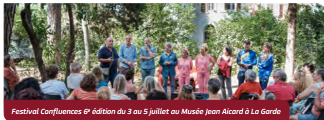
Festival Confluences 6 e édition du 3 au 5 juillet au Musée Jean Aicard à La Garde