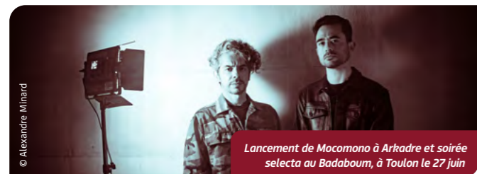
Lancement de Mocomono à Arkadre et soirée selecta au Badaboum, à Toulon le 27 juin