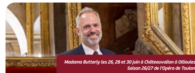
Madama Butterfly les 26, 28 et 30 juin à Châteauvallon à Ollioules Saison 26/27 de l'Opéra de Toulon