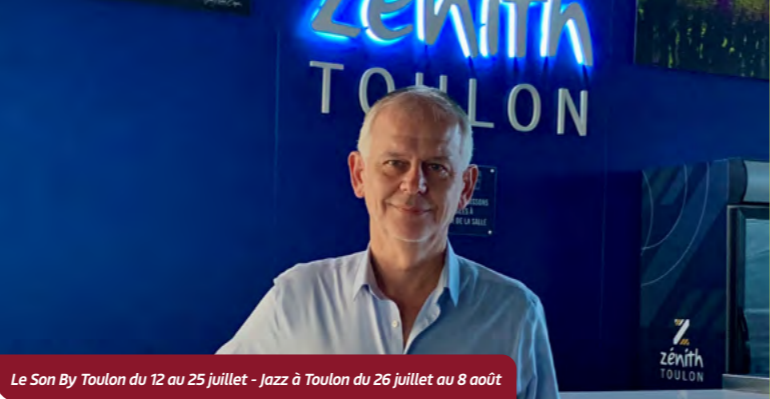
Le Son By Toulon du 12 au 25 juillet - Jazz à Toulon du 26 juillet au 8 août