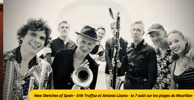
New Sketches of Spain - Erik Truffaz et Antonio Lizana - le 7 août sur les plages du Mourillon